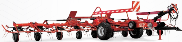
Faneur Spider 1100/10T