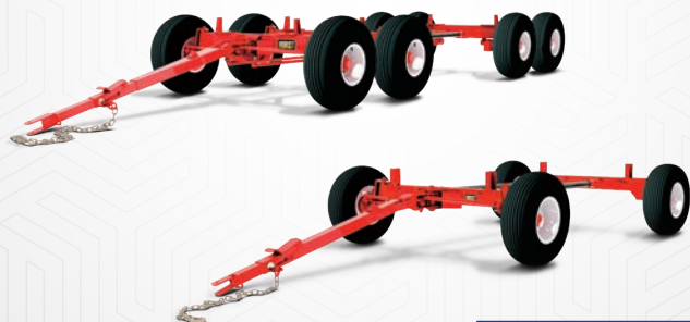
Modèle 4 roues