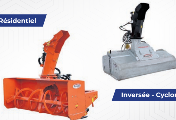
Inversée - Cyclone