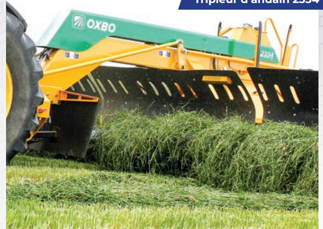
Tripleur d'andain 2334