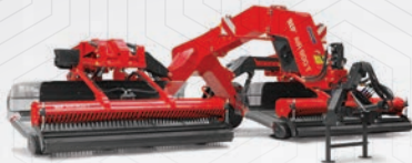
Doubleur d'andain Air 900T