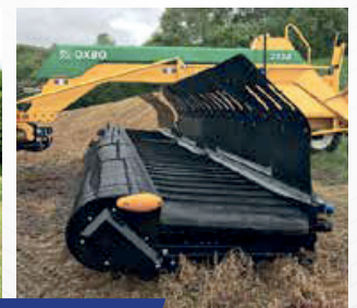
Andaineur simple 2114