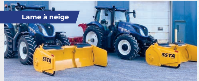
Lame à neige